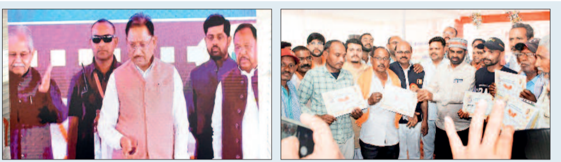
किसान हित सर्वोपरि, भाजपा का संदेश

मुख्यमंत्री विष्णुदेव साय ने राज्य के 25 लाख 28 हजार किसानों के खाते में 10 हजार 324 करोड़ रुपये की आदान सहायता राशि का अंतरण किया है। साय बिलासपुर जिले के बिल्हा विकासखण्ड के ग्राम रहगी के खेल मैदान में राज्य सरकार के महत्वाकांक्षी कृषक योजना अंतर्गत समर्थन मूल्य पर धान खरीदी कार्य के अंतर्गत किसानों के अंतर की राशि का वितरण हेतु आज आयोजित आदान सहायता वितरण कार्यक्रम के अवसर पर बटन दबाकर ऑनलाईन राशि का अंतरण किया। इस दौरान मुख्यमंत्री श्री साय ने बालोद जिले के 01 लाख 48 हजार 293 किसानों के खाते में भी 511 करोड़ 11 लाख 06 हजार रुपये की राशि का अंतरण किया। जिले के सभी पांचों विकासखण्डों के कृषि उपज मण्डी एवं प्राथमिक सेवा सहकारी समितियों में आदान सहायता राशि वितरण ▶▶ शेष पेज 4 पर